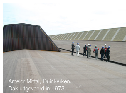
Arcelor Mittal, Duinkerken. Dak uitgevoerd in 1973.