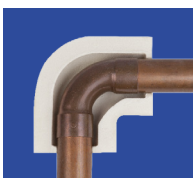
coude en cuivre