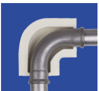
coude à sertir longue