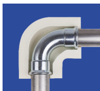
coude à sertir courte