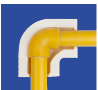
coude en plastique