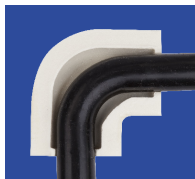
coude é souder