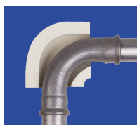
coude à sertir longue