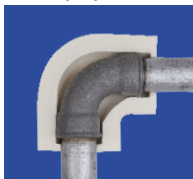
coude en fonte malléable