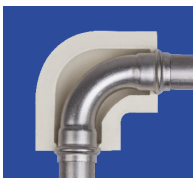
coude à sertir Optipress