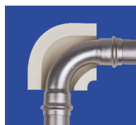
coude à sertir Optipress