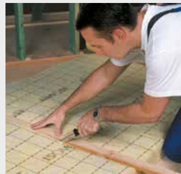
Fig. 2 Snij de gewenste breedte langs de maatstrepen af met een lat en het ISOVER isolatiemes.

A l'aide du couteau ISOVER coupe laine et d'une latte, coupez à dimension en suivant les prémarquages.