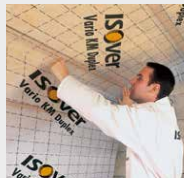
Fig. 4 Breng een lucht/dampscherm aan, zoals ISOVER vario KM duplex.

Appelez un pare-vent/ vapeur, comme l' ISOVER vario KM duplex.