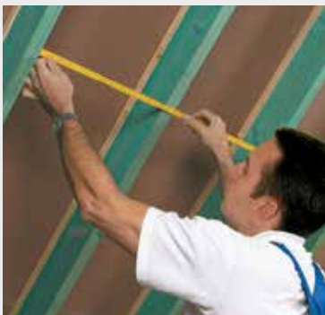
Fig. 1 Meet de ruimte tussen 2 kepers en voeg hier 1 à 2 cm aan toe. Mesurez la distance entre 2 chevrons et ajoutez-y 1 à 2 cm.

L'application d'un pare-vent/vapeur est indispensable pour assurer l'étanchéité à l'air et à la vapeur d'eau (fig.4). Le pare-vapeur à base de polyamide au pouvoir asséchant est décrit dans la fiche ISOVER vario KM duplex.