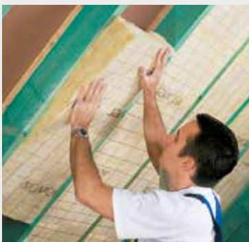
Fig. 3 Klem de isolatie tussen de kepers. Coincez l'isolation entre les chevrons.

A l'aide du couteau ISOVER coupe laine et d'une latte, coupez à dimension en suivant les prémarquages.