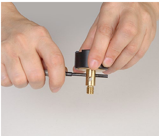
4. Die Isolierhülse lösen.