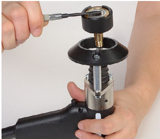
3. Den Magnetbolzenhalter anheben.