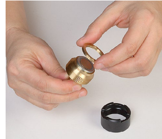
6. Den Kontakttring abnehmen.