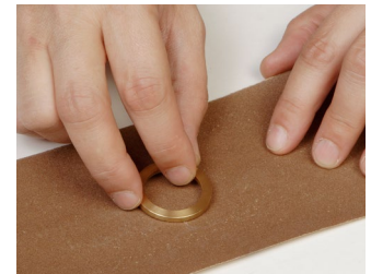
Haftmagnet und Kontakttring können anstatt ausgetauscht oft auch gereinigt werden. Dazu einige Male mit der verschmutzten Seite über feines Schleifpapier bewegen.