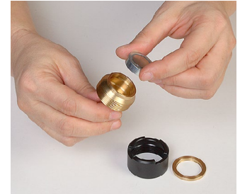
7. Den Magnet abnehmen.