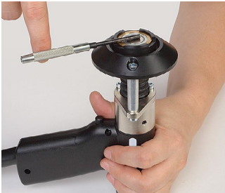
2. Den Magnetbolzenhalter herausdrehen.