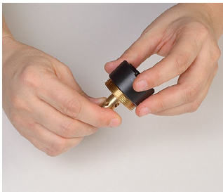
5. Die Isolierhülse abnehmen.