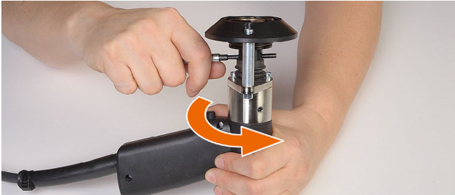
1. Die Magnethülse der Schweißeinheit an der Pistole lösen.