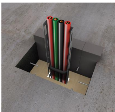
4. Waar nodig een bekisting voorzien in minerale wol, hout of ander materiaal (in functie van de afmetingen van het doorgevoerde element).