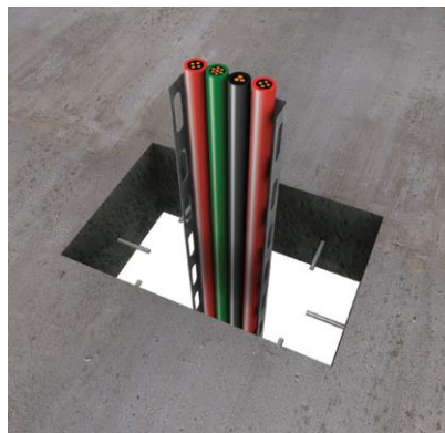
2. Bij toepassingen in massieve vloeren: om de 250 mm 80 mm lange slagankers aanbrengen à rato van min. 1 slaganker per zijde. Deze moeten over een minimumdiepte en met een minimale dekking van 40 mm in de vloer worden aangebracht.