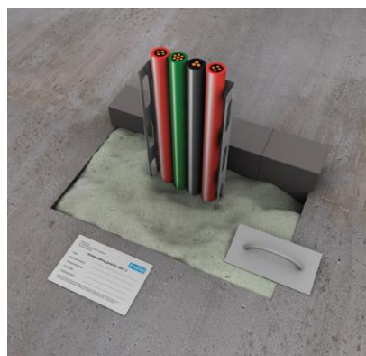
6. Srijk het oppervlak glad.