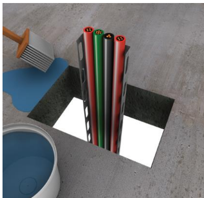
1. Reinig de opening met water.