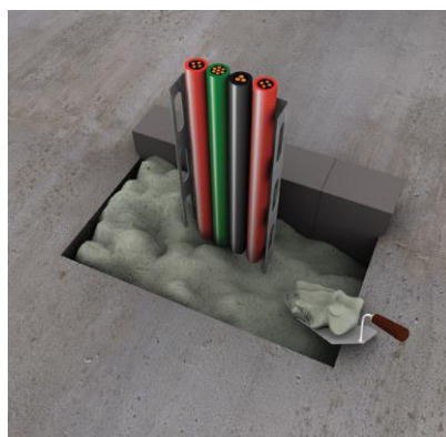
5. Vul de resterende opening op met PROMASTOP®-M brandwerende mortel. Bij grotere openingen eventueel een extra laag aanbrengen om juiste dikte of te bekomen.